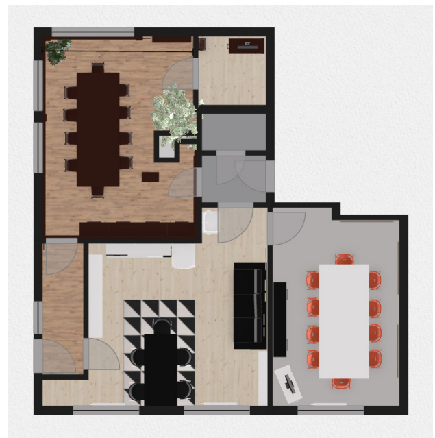
Grundriss der neuen Räumlichkeiten

Zusätzlich gestalten wir eine gemütliche Lounge mit kleiner Küche und Platz für zahlreiche Brettspiele und eine Bibliothek voller RPG-Nachschlagewerke.